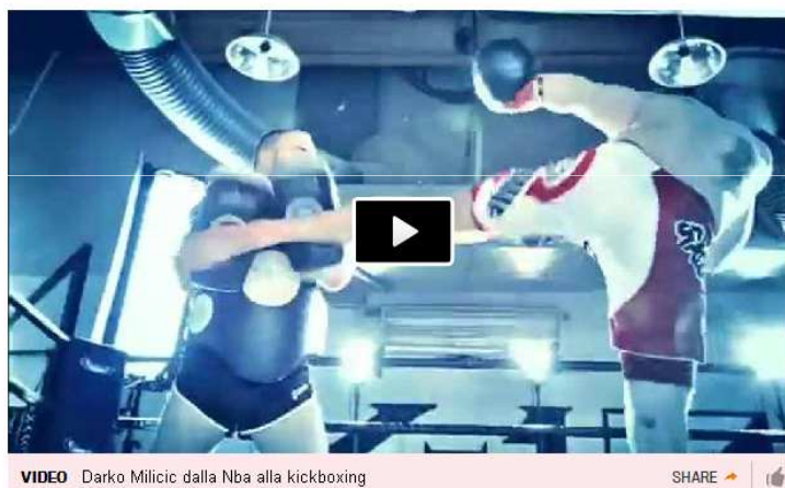
VIDEO Darko Milicic dalla Nba alla kickboxing

Giovedì 18 dicembre è il primo giorno della nuova vita di Darko Milicic. In Nba è stato la seconda scelta assoluta al draft 2003, subito dopo LeBron James, subito prima di Carmelo Anthony, Chris Bosh e Dwyane Wade. Ha fatto da comparsa nel titolo di Detroit 2004, ma non ha mai reso come ci si aspettava dalla seconda chiamata di uno dei draft più forti di sempre. A 29 anni, dopo aver detto addio al basket, il serbo riparte dal ring, dalla kickboxing, dal suo primo incontro da professionista.